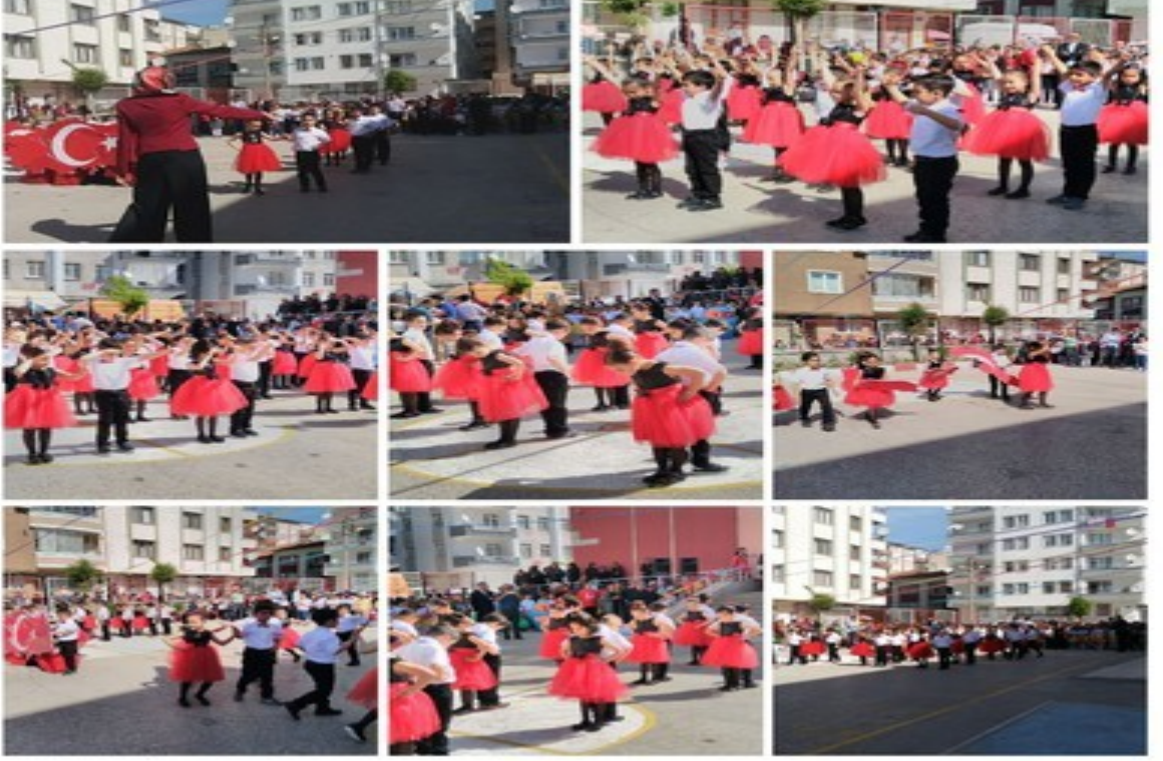
ATATÜRK ÇOCUKLARI GÖSTERİMİZ