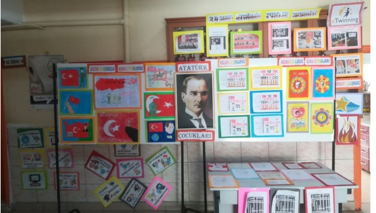
YIL SONU SERGİMİZ